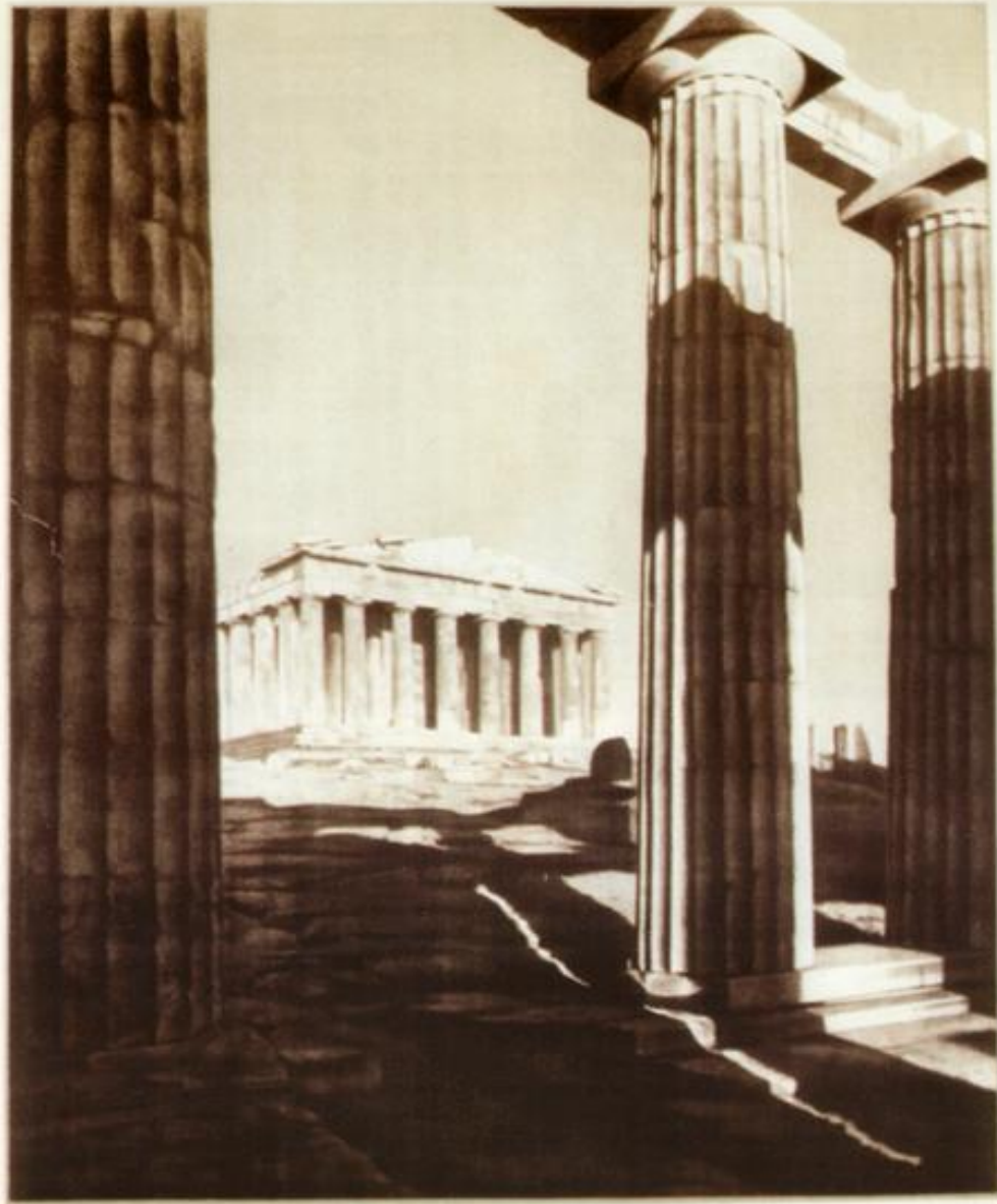
Athènes: Le Parthénon